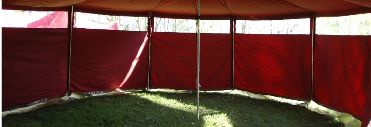
Ansicht der aufgestellten seitl. Aufstellstangen unter den Dach-Eckpunkten (in einer bereits vollständig aufgebauten Jurte)

Nach dem Aufstellen dieser Stangen die Abspannseile entsprechend nachspannen.